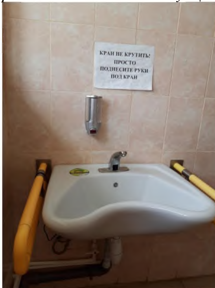
Муниципальное казенное учреждение «Центр помощи детям, оставшимся без попечения родителей» Кизильского муниципального района